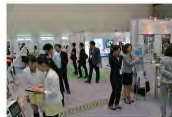
企業出展ブースの様子。65社もの企業に出展頂きました。