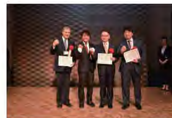
学会長主催パーティーの様子。