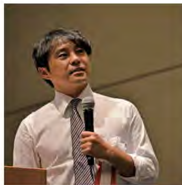
学会長講演の様子。経営やリーダーシップについて熱く話しました。